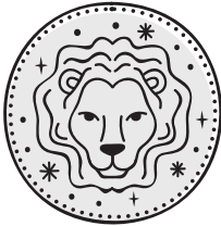
LEONE 23/07 - 23/08