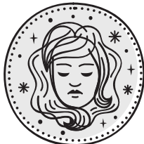
VERGINE 24/08 - 22/09