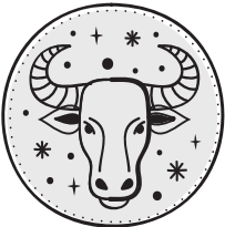
TORO 20/04 - 20/05