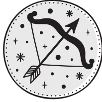
SAGITTARIO 22/11 - 21/12