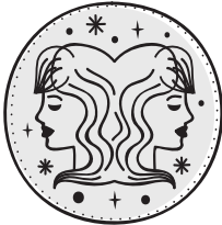
GEMELLI 21/05 - 20/06