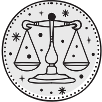
BILANCIA 23/09 - 22/10