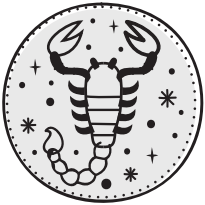
SCORPIONE 23/10 - 21/11