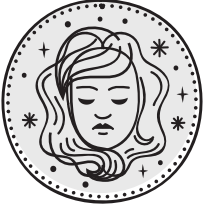
VERGINE 24/08 - 22/09